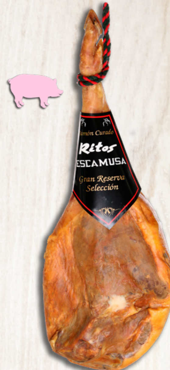
Jamón Gran Reserva Selección Graso