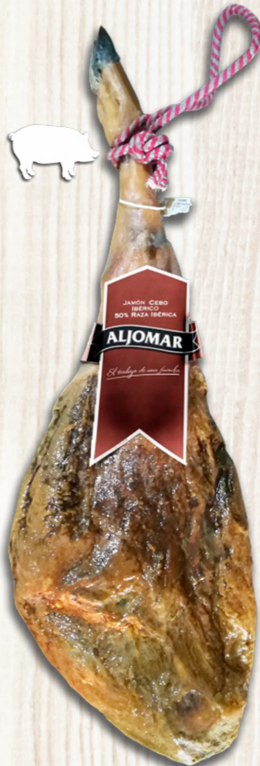
Jamón Ibérico de Cebo CÓDIGO: 105001014 ORIGEN: Guijuelo (Salamanca) 50% ibérico