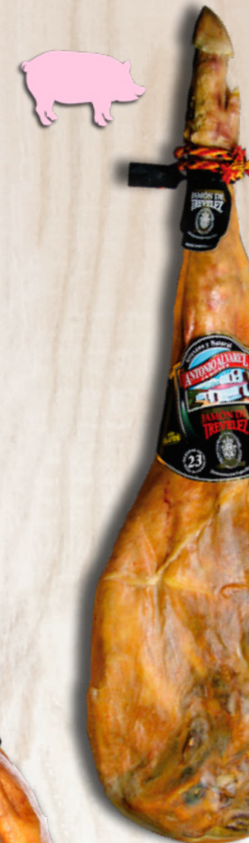
Jamón Serrano IGP Trévez