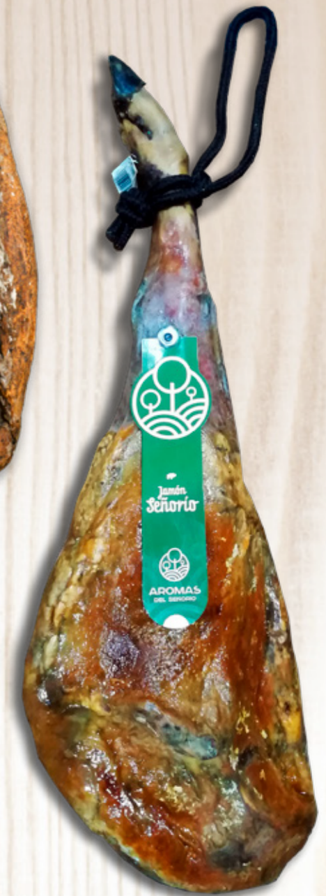
Jamón Aromas del Señorío CÓDIGO: 105001098 ORIGEN: Guijuelo (Salamanca)