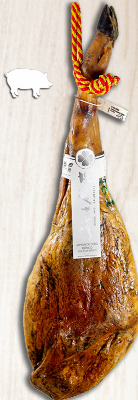
Jamón Ibérico de Cebo CÓDIGO: 105001090 ORIGEN: Salamanca 50% ibérico