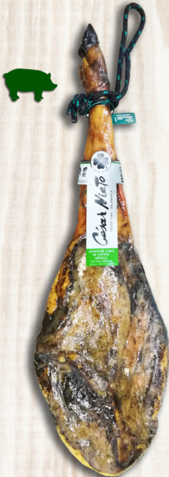
Jamón Ibérico de Cebo de Campo CÓDIGO: 105001089 ORIGEN: Salamanca PESO: De 8 a 9 kg