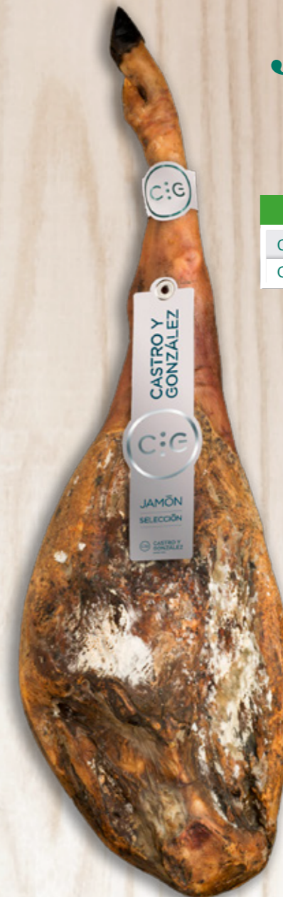
Jamón CYG Selección CÓDIGO: 105001025 ORIGEN: Guijuelo (Salamanca)