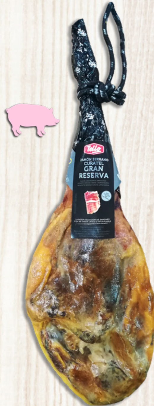
Jamón Serrano Curatel Gran Reserva

Para esta denominación deben cumplir una serie de requisitos, como un mínimo de 7 meses de curación y un peso y grosor de la grasa determinados, así como una serie de características que lo hacen único.