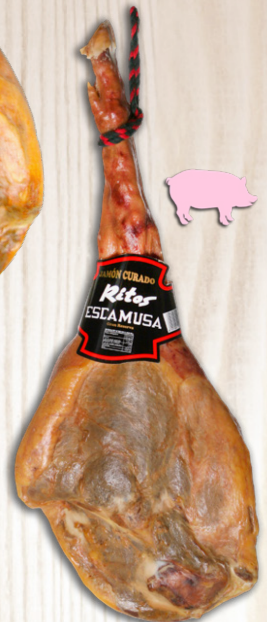
Jamón Gran Reserva Semigraso (Corte V)

100% Natural (sin aditivos ni conservantes)