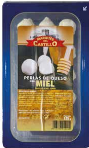
M. DEL CASTILLO- PERLAS RELLENAS DE MIEL 107001411