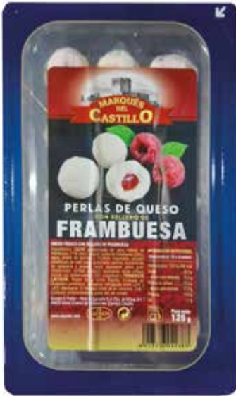
M. DEL CASTILLO- PERLAS RELLENAS DE FRAMBUESA 107001410