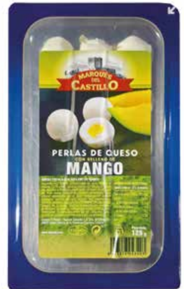
M. DEL CASTILLO- PERLAS RELLENAS DE MANGO 107001412

Paquete de 125 gr (15 perlas) | Caja de 8 unidades | Venta por ud/cajas