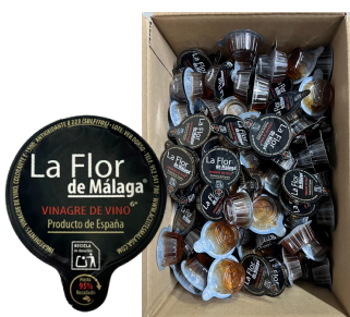
Vinagre de Vino Blanco de 10ml Monodosis (REF: 108003090) // (T.N.)