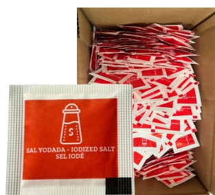
Sal Yodada 1gr Monodosis (REF: 108005373) // (T-20)