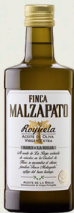
Aceite Oliva Royuela (REF: 108003077)