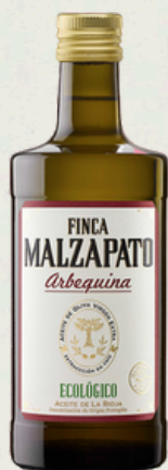
Aceite Oliva Arberquina (REF: 108003079)