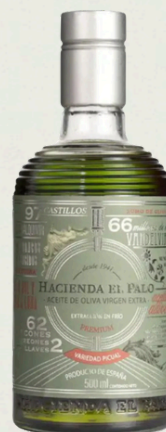
Aceite Hacienda del Palo (REF: 108003099)